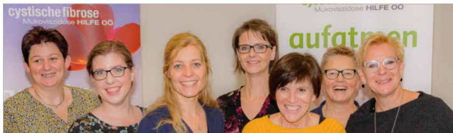
Vorstand der CF Hilfe OÖ

2021 leistete die CF Hilfe OÖ rund 2.693 ehrenamtliche Stunden.