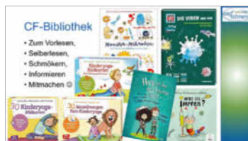
Neu angekaufte Bücher aus unserer Bibliothek