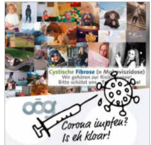
CF-Posting für Impfung