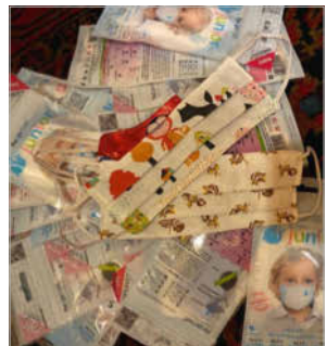
Danke für die vielen Maskenspenden von Fa. Menzl und Goldhauben Puchenu