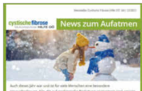
Newsletter Dezember 2021