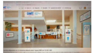
Mukoviszidose-Tagung Würzburg online