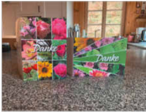
Dankeskarten für Spender* innen