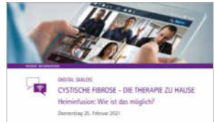
Webinar CF- Die Therapie zu Hause online