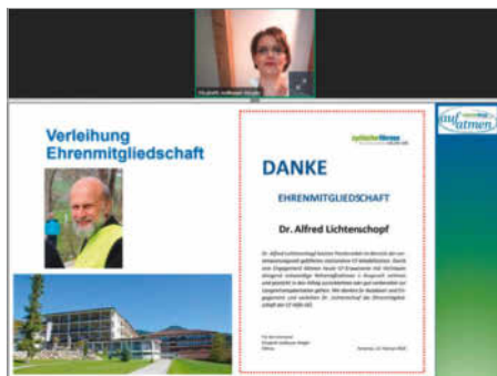
Generalversammlung CF Hilfe OÖ, Februar