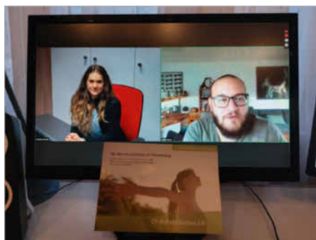
Interdisziplinäre CF-Fortbildung, November