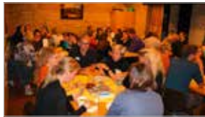
CF-Infoabend September, Puchenu