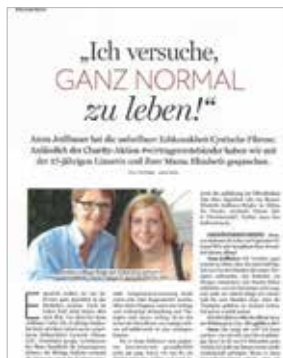
Interview für Zeitung „Die Oberösterreicherin“