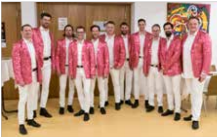
Die Rauschenden Birken, Benefizkonzert Linz