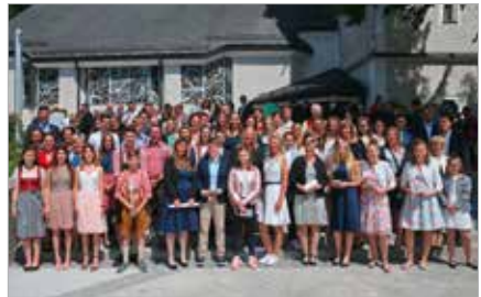
Spende Firmlinge Dietach