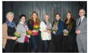
CF-Erwachsenenteam KUK Linz

MedCamp. III Linz: Das Erwachsenenteam präsentierte sich am CF-Infoabend im Februar. Mit Ende 2018 werden 15 Patienten betreut.