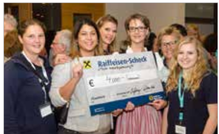
Spende Benefiz-Nostalgie-Tennisturnier, Vöcklabruck