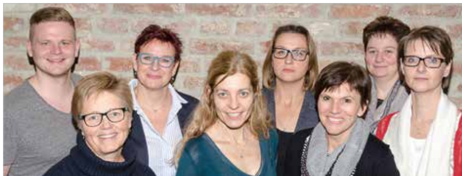
Vorstand der CF Hilfe OÖ

Der Vorstand der CF Hilfe OÖ arbeitet ehrenamtlich. 2018 leistete die CF Hilfe OÖ rund 4000 ehrenamtliche Stunden.