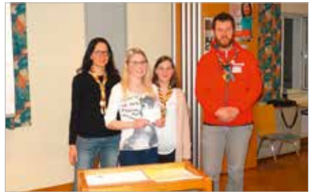
Spende Pfadfinder Vorchdorf