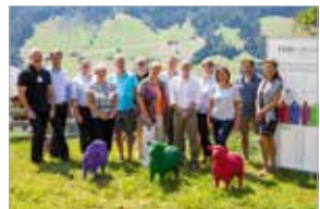
TeilnehmerInnen Forum Alpbach