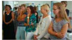
Antibiotikatag Juni, Klinikum Wels