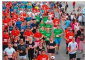
Laufteam für CF in grünen Shirts