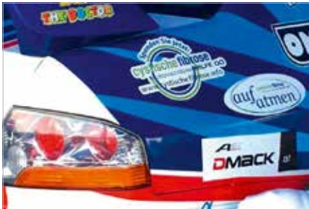
CF-Aufkleber für Rallyeauto