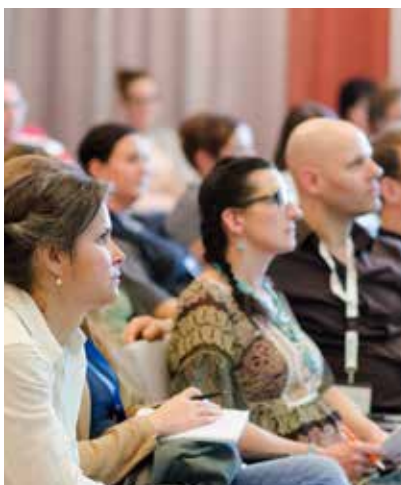
OÖ CF-Tag, Blick auf TeilnehmerInnen