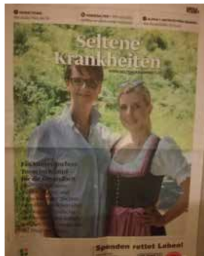
Zeitungsartikel mit Interview