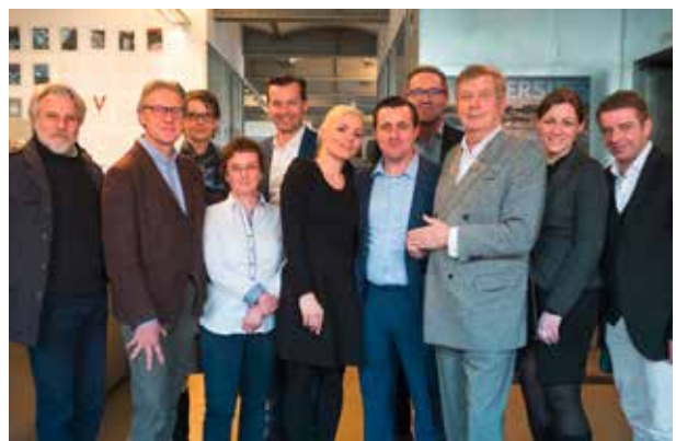
Start Projekt Atmos