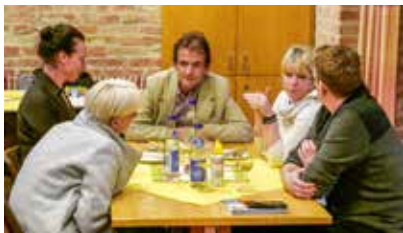
CF-Abend „Alles Hygiene“, Zusammensitzen nach dem Vortrag