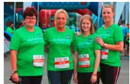
Laufen für CF