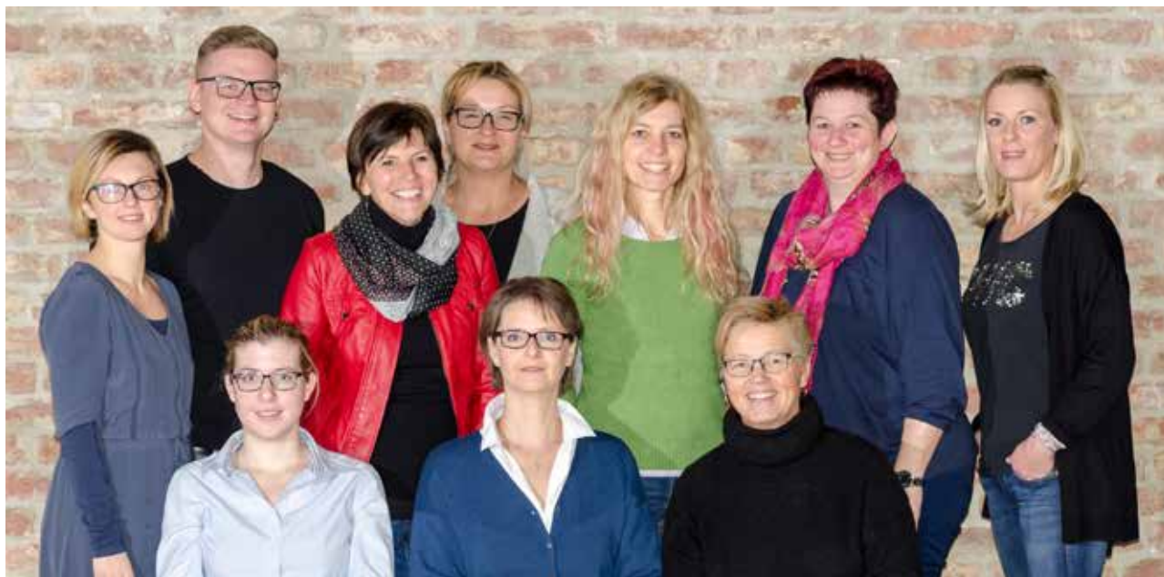
Vorstand CF Hilfe OÖ