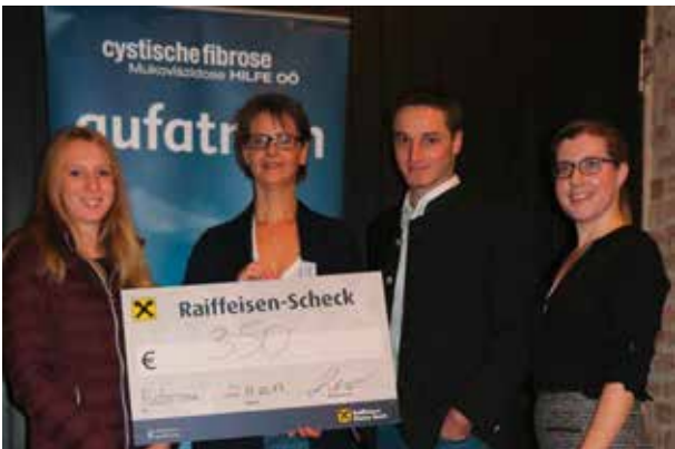
Spendenübergabe Landjugend Oftring-Wilhering