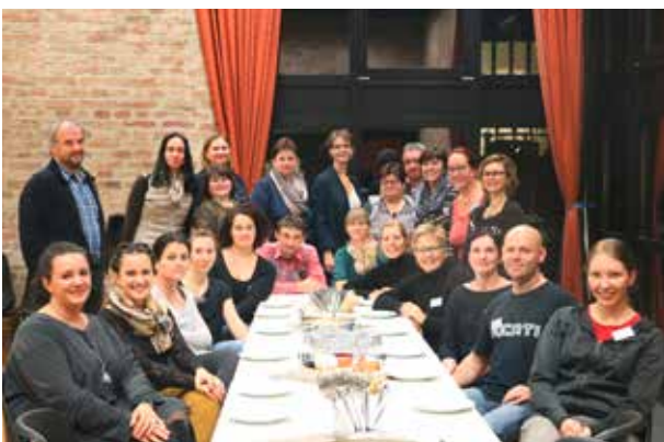
HelferInnen beim Keks verpacken