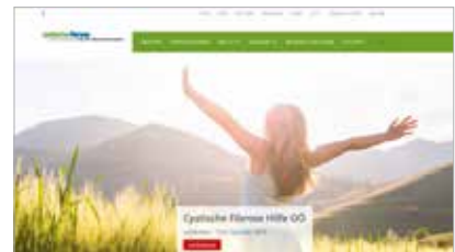
Startseite neue Homepage