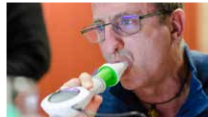
Möglichkeit zur Lungenfunktion bei CF-Abend