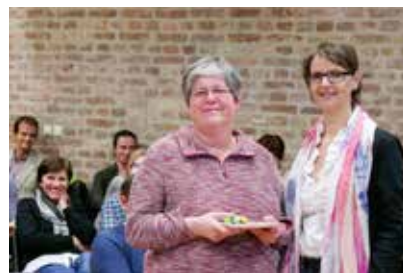
Ehrung 10jährige Mitgliedschaft