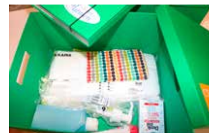
Blick in die CF-StarterBOX