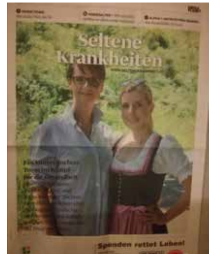
Zeitungsartikel mit Interview