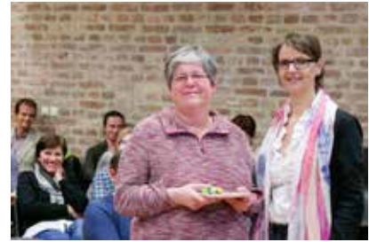
Ehrung 10jährige Mitgliedschaft