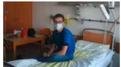
1. Patient zur IV Therapie am KUK Med III