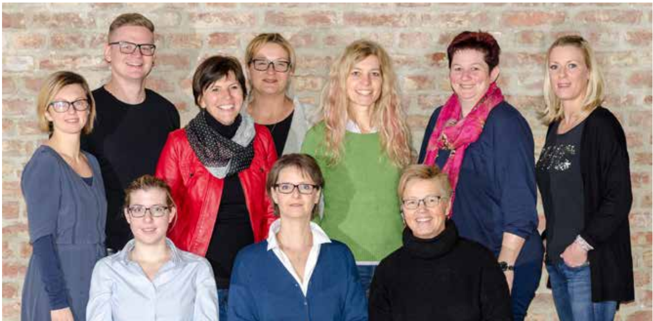
Vorstand CF Hilfe OÖ